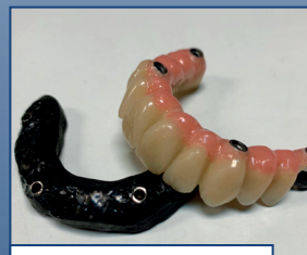
Subestructuras y barra híbridos