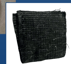
Hoja fibra MAT