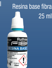
Resina base fibra 25 ml