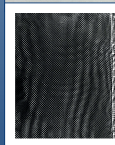
UHM alto módulo