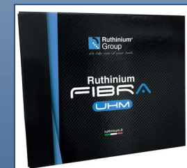
Caja fibra UHM alto módulo